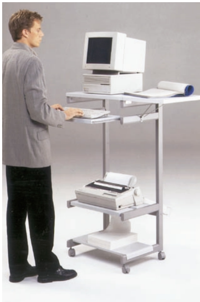
Data-Rolly álló munkahelyként

A Data-Rolly egy gördíthető számítógép- és nyomtatóállvány, elhelyezhető rajta a számítógépes hardver. A munkafelület bővítésére szolgál, de többfunkciós munkahelyként is felhasználható. A Data-Rolly-n van hely a számítógép, a monitor, a billentyűzet, a nyomtató és a papír számára is. Ezáltal értékes helyek szabadulnak fel az íróasztalon. A Data-Rolly stabil acélszerkezettel rendelkezik, és szőnyegkímélő görgőkkel van ellátva. A billentyűzettartó és a felső lap rétegelt fából készül, és melamingyantával van bevonva. A Data-Rolly az összes típusú nyomtatóhoz alkalmazható, mivel a papírt előlről, alulról és hátulról is be lehet fűzni.