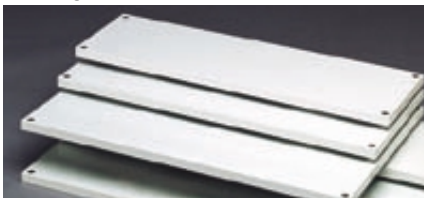
300, 400 és 600 mm mély polclapok