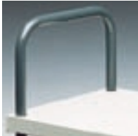
Kerek felső támasztó