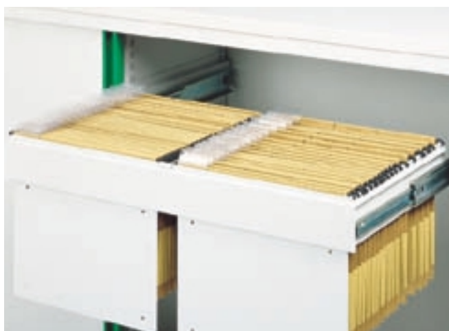
Kihúzható keretek a függőmappák számára

Az irodatervek hatékonyságának egyik legfontosabb kritériuma a szervezés. A rend kialakítása és megtartása teszi lehetővé a rutinszerű munkavégzést. A félmagas szekrények programja ehhez kínál megfelelő megoldási lehetőségeket. Az elemek problémamentesen integrálhatók az adott munkaterületre, és adnak helyet az iratoknak.