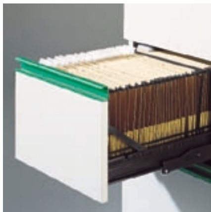
Fiók aljjal és alj nélkül

Az SSI SCHÄFER írattároló szekrényei segítségével a lerakott iratok áttekinthetővé válnak. Minden elérhető a legkülönbözőbb szervezési feladatok számára. A tartóke- retek könnyen járó, teleszkópgörgős síneken teljes mélységben kihúzhatók, és a szekrények központilag zárhatók. A szekrények nyílászáró lemezei az ergonómiailag megfelelő fogantyúkkal a planova berendezési rendszerek fő színeiben készülnek. A különböző nagyságú és kivitelű elemek kombinálásával minden írattárolási feladatot ésszerűen meg lehet oldani.