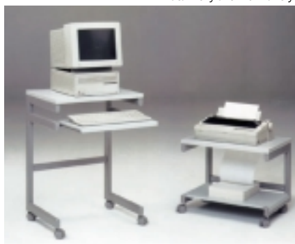
Data-Rolly félmagas elemként

A Data-Rolly különböző kivitelekben készül, így használható görgős elemként a normál asztalkombinációkhoz, és különálló munkasztalként is. Funkcionális szerkezete és a jó minőségű anyagok kiváló megmunkálása teszi a Data-Rolly-t ideális partnerré az irodában, ha arról van szó, hogy a számítógép alkotórészeit helytakarékosan és áttekinthetően kell az irodai munkára készletbe helyezni.