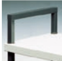
Négyzetes felső támasztó